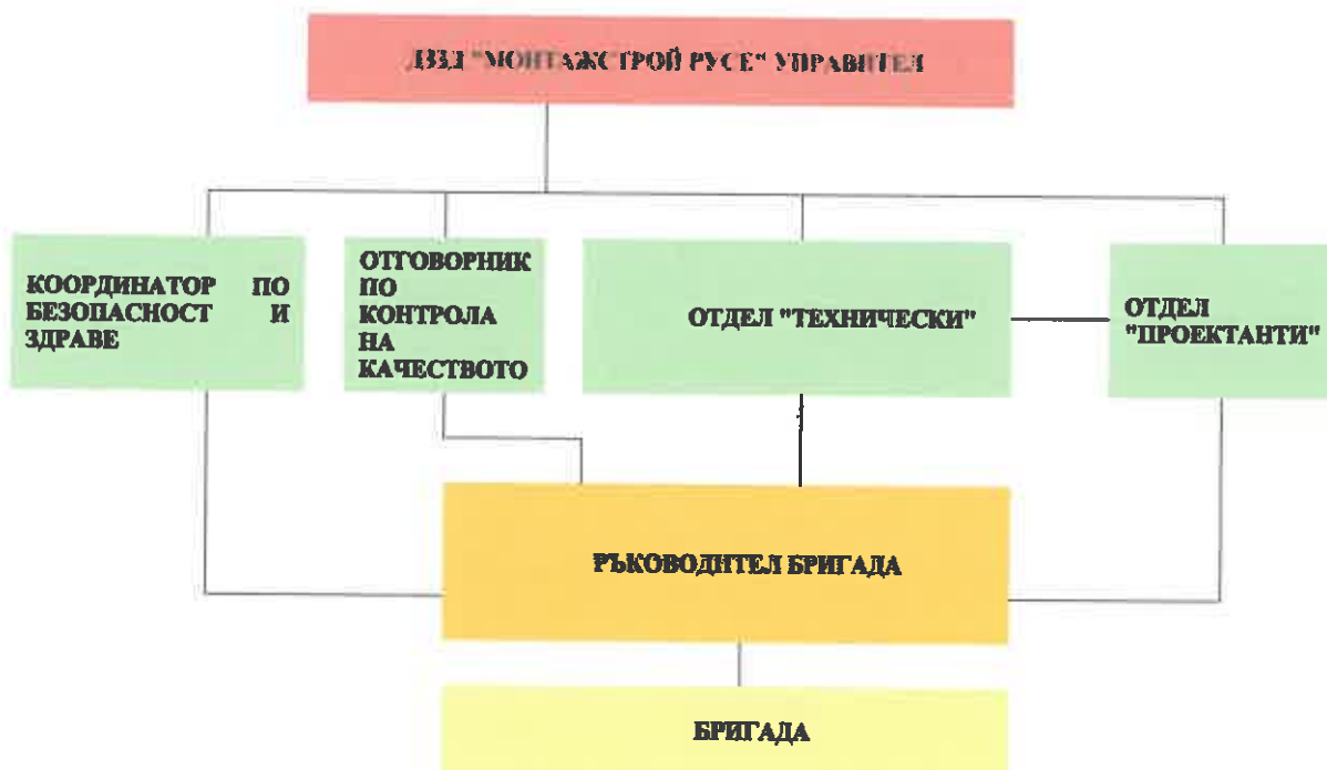
Схема.1 Структура на управление на човешките ресурси за изпълнението на поръчката